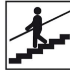
Loop rechts op de trap

team te zien. En is de foto compleet, dan is er een schoolbrede beloning!